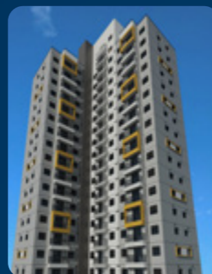
La Vista Jd. Avelino