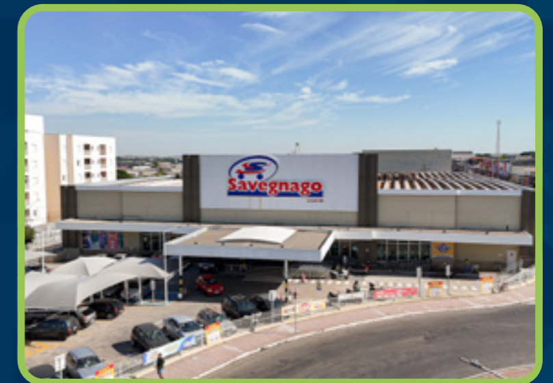
Foto aérea do Savegnago.