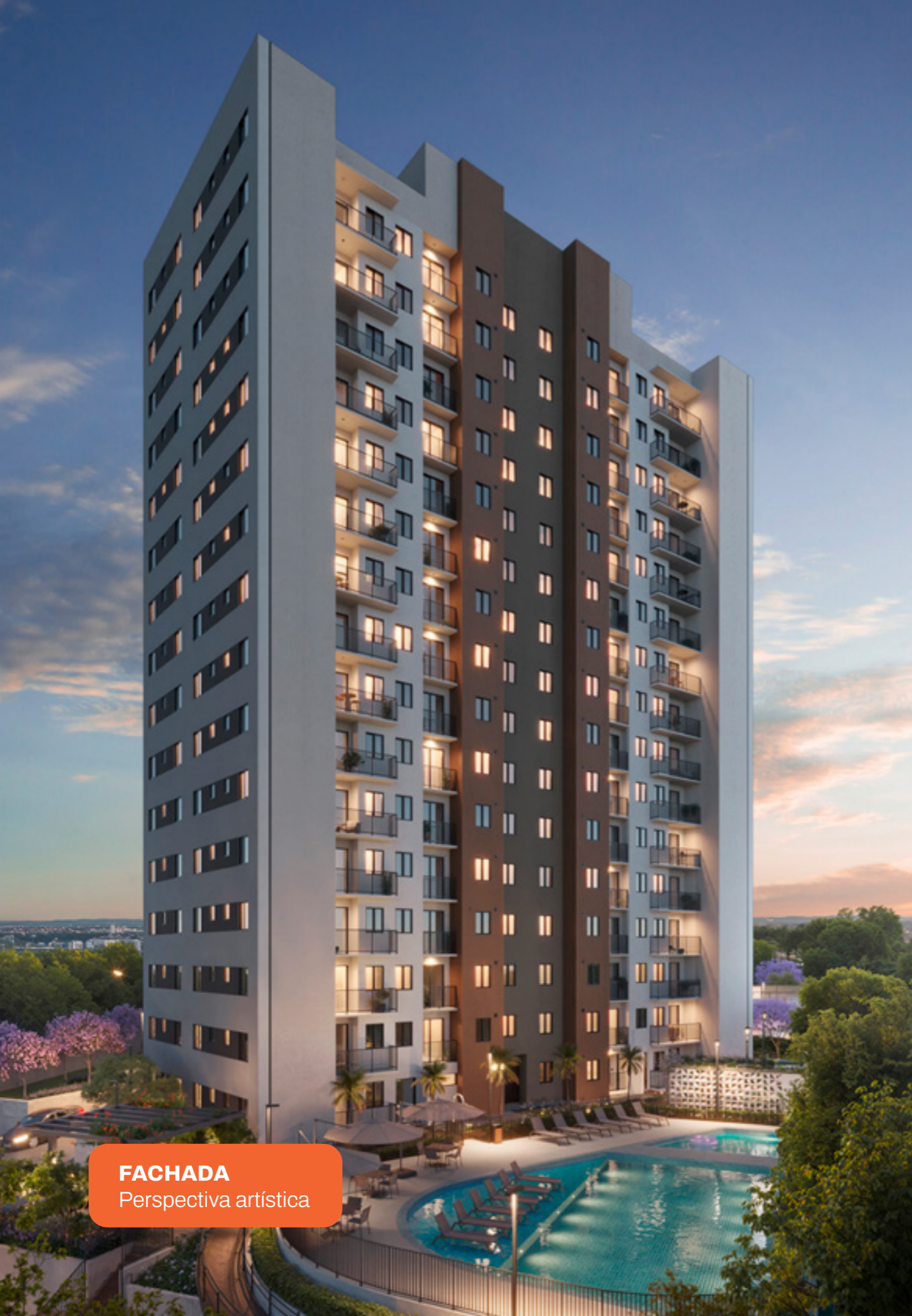
FACHADA Perspectiva artística