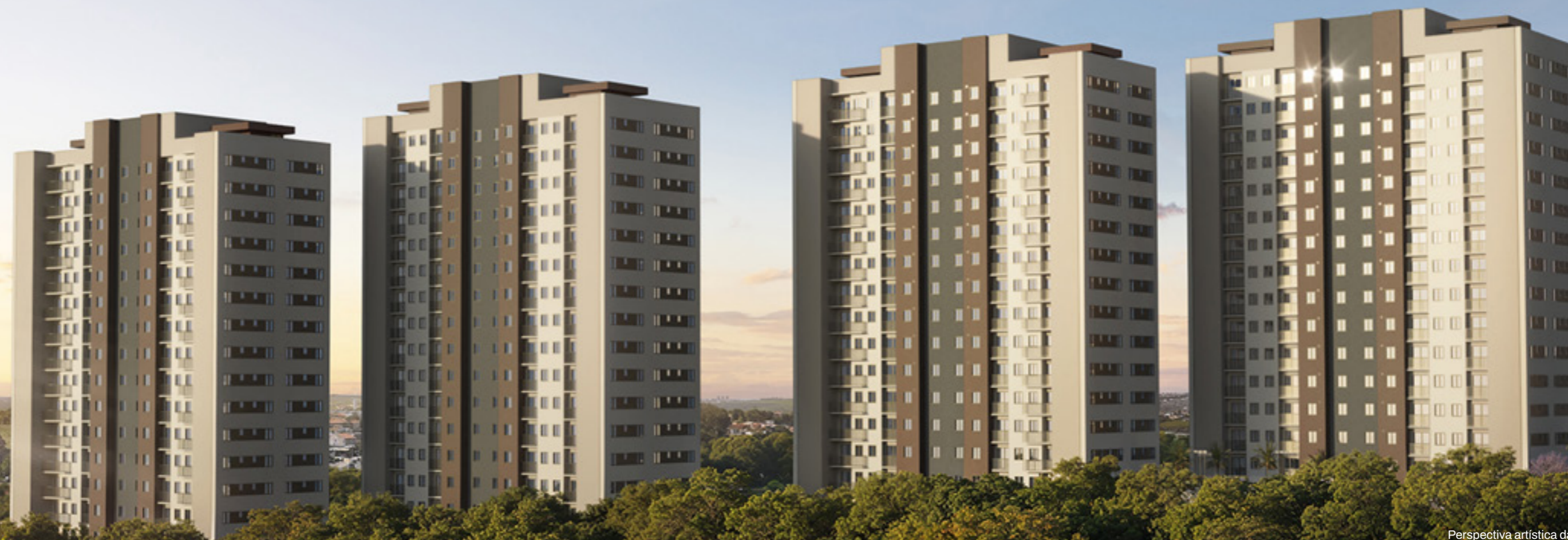
Perspectiva artística das torres.