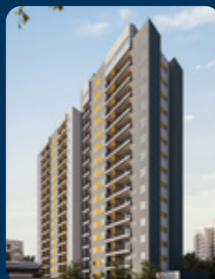
La Vista Lapa