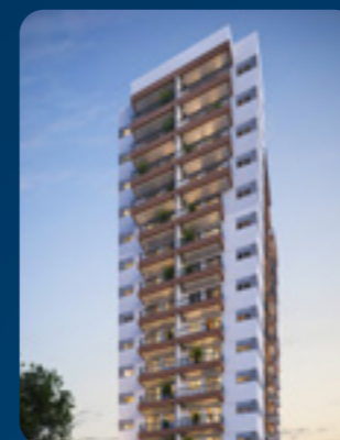
Virgílio 426 Pinheiros