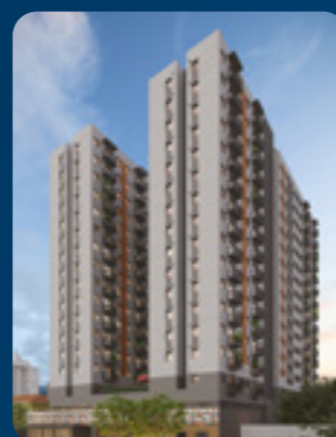
Rev Home Club Vila das Belezas