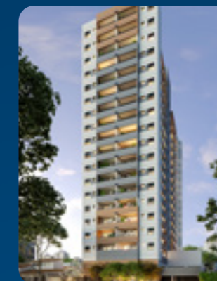
Flow Vila Matilde