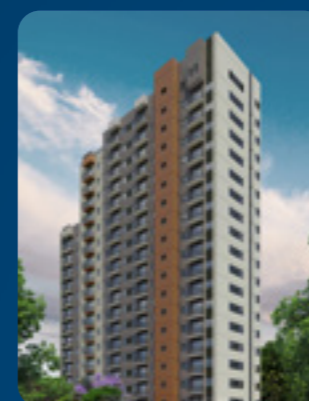
Twist Alto de Mooca