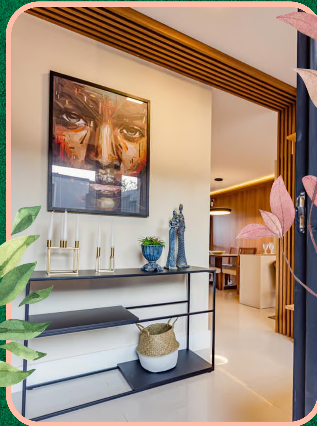
Hall de entrada