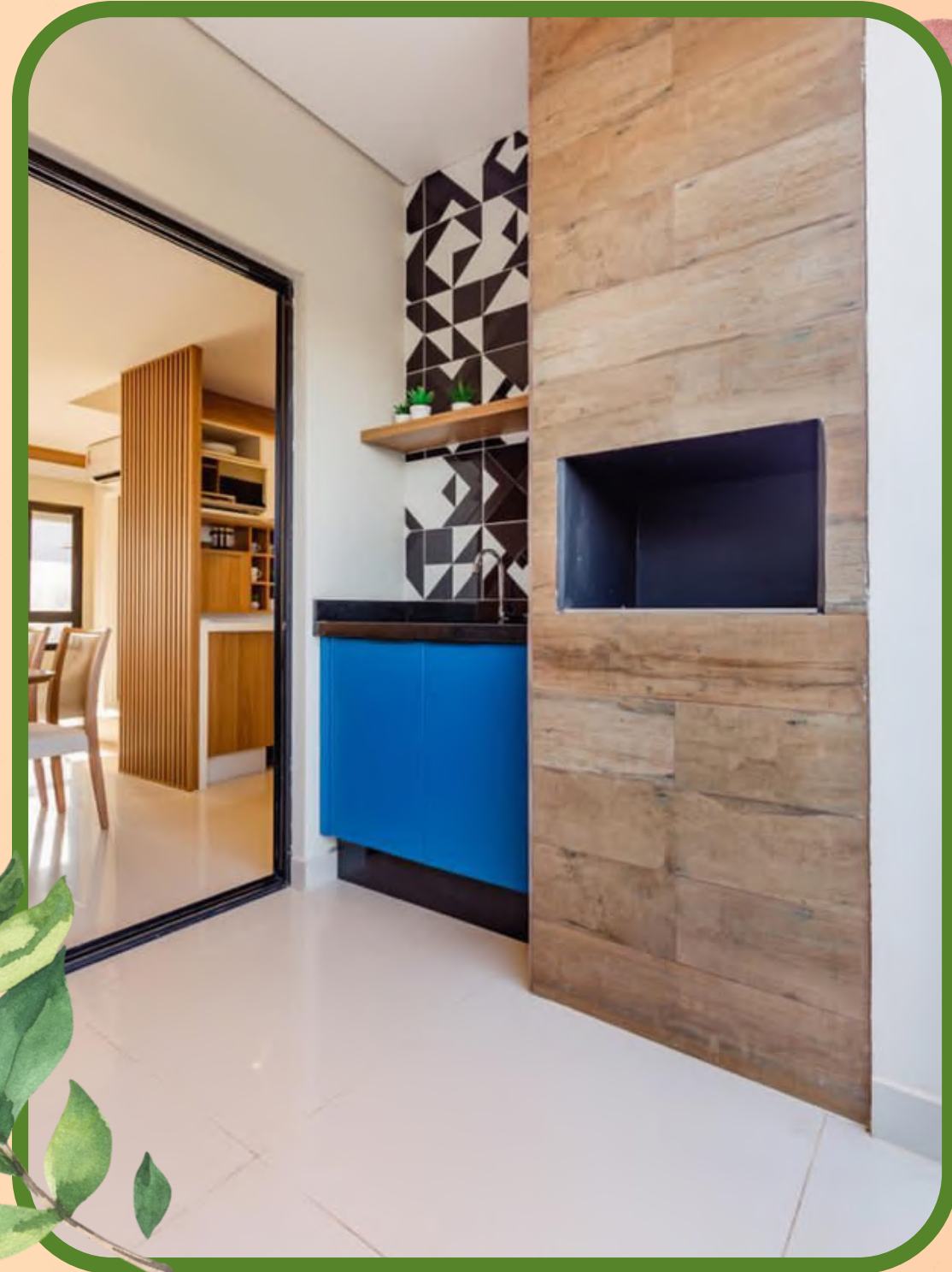
Espaço Gourmet com churrasqueira