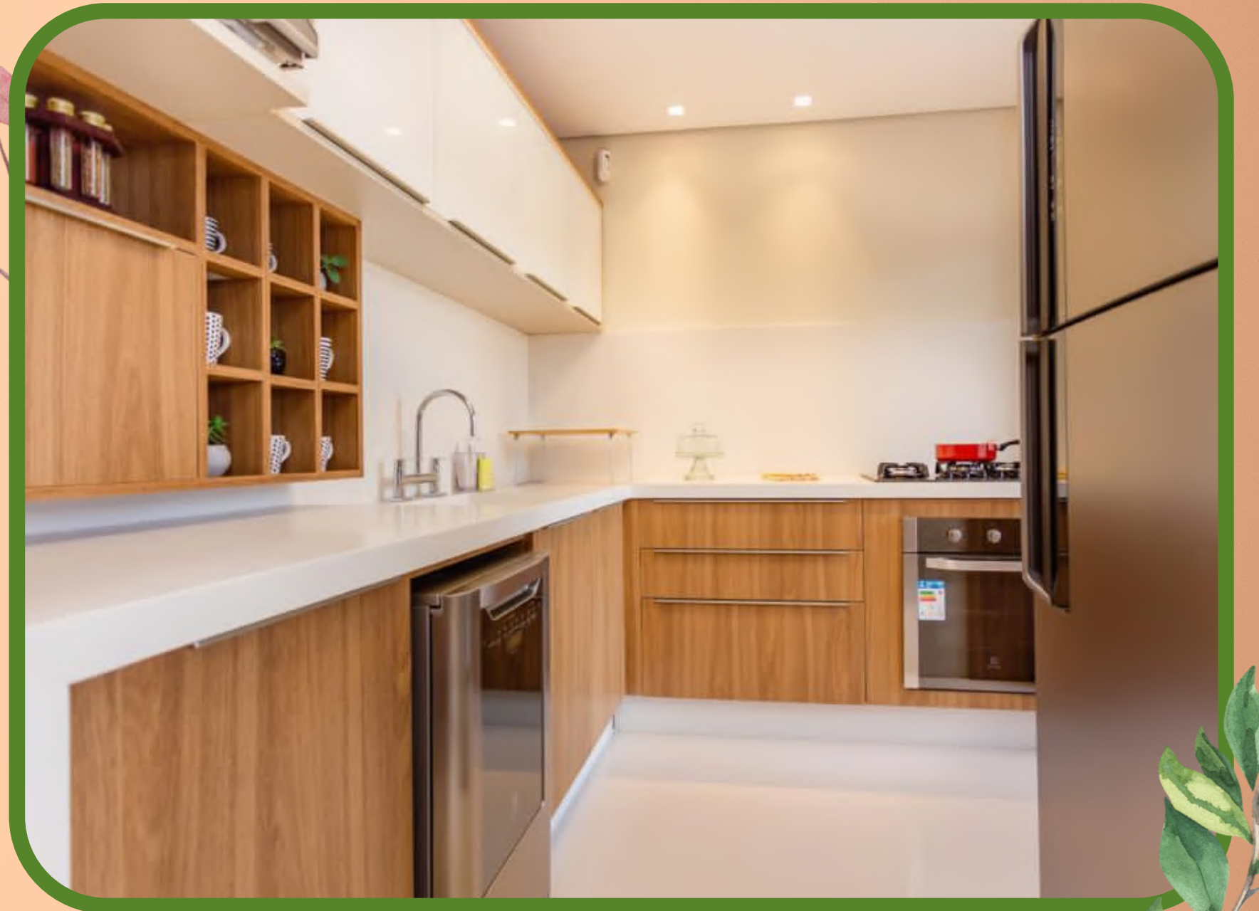
Imagem real do decorado